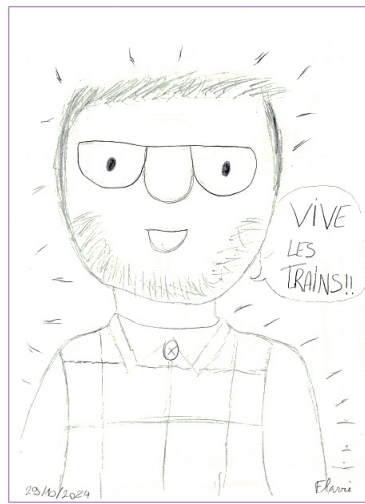
Votre serviteur, Papi Coco, dessiné par Flavie