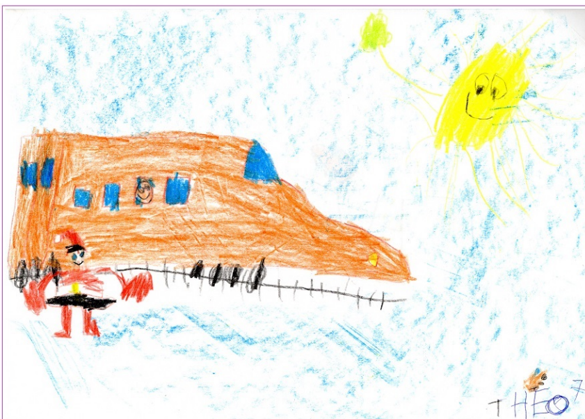
Le TGV de Théo, avec le nez du TGV M (tout nouveau TGV devant être mis en service en 2026), mais dans une couleur proche de celle de « Patrick » (nom de baptême du tout premier TGV de présérie sortie d'usine en 1978)