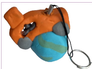
2 trains en pâte à cuire, celui de droite façon porte-clés / globe trotter autours du monde