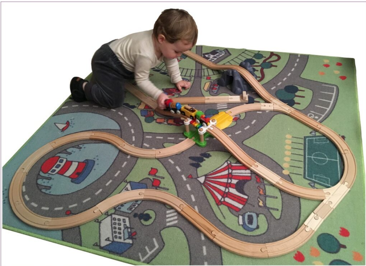
21 mois, son PRCI (Petit Réseau de Chérubin Ingénieurs) n'a pas encore besoin de JAO... (concernant le JAO Système, voir le wagon réseaux avec les anciens PRCI MINI et PR)