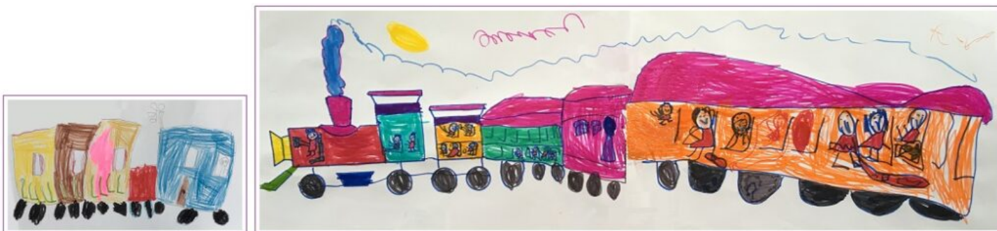
A gauche 4 ans 1/2, à droite 5 ans 1/2, ci-dessous 6 ans 1/2