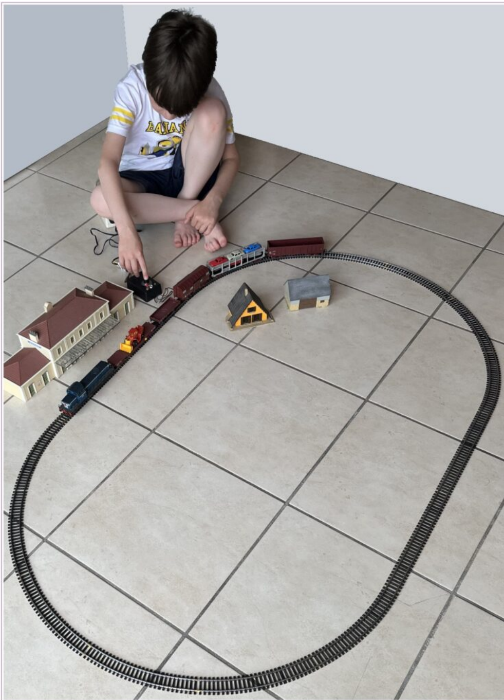
Quelques années plus tard, toujours pas de JAO, mais le matériel a changé et celui-là est plus compatible (la gare est celle qui avait été initialement prévue pour le réseau PR, le matériel roulant est de l'ancien Jouef)